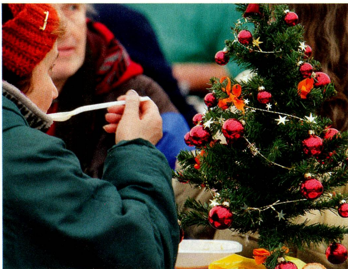
Weihnachtsfeier für Bedürftige in Lausanne.

Gewiss, gemäss der Statistik hat sich die Einkommensverteilung in den letzten zwei Jahrzehnten nicht wesentlich verändert. Doch die persönliche Wahrnehmung der Menschen ist eine andere: Ihr Blick ist nach unten zu den Armen und nach oben zu den Reichen gerichtet. Nicht weniger als 380 000 Menschen im Alter zwischen 20 und 59 Jahren galten im Jahr 2006 als arm, was einem Anteil von 9,1 Prozent entspricht (so das Bundesamt für Statistik). Viele Arbeitnehmer haben in den letzten Jahren keine oder nur geringe Reallohn erhöhungen erhalten, die von den gestiegenen Krankenkassen-