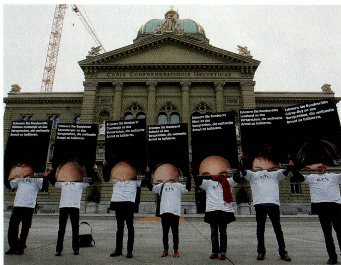
Demonstration gegen Armut vor dem Bundeshaus.

Christin Kehrl, Carlo Knöpfel: Handbuch Armut in der Schweiz. 2006 Caritas-Verlag, Luzern. CHF 42.- Sozialalmanach 2008: Bedrängte Solidarität. 2007 Caritas-Verlag, Luzern. CHF 34.- Hans Kissling: Reichtum ohne Leistung. 2008 Rüegger Verlag, Zürich/Chur. CHF 26.-, EURO 16.60 Dokumentationszentrum doku-zug ( www.doku-zug.ch )