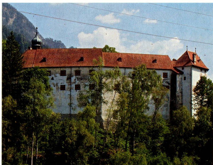
Schloss Rhäzüns, das Wochenendhaus der Familie Blocher.