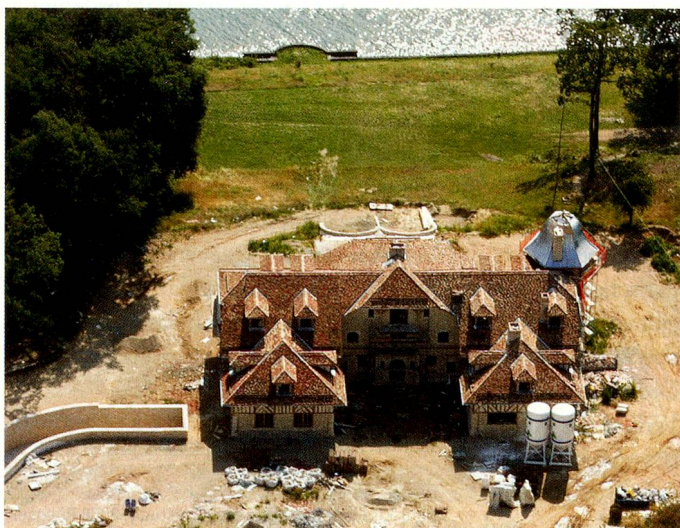
Michael Schumachers Anwesen am Genfersee.

■ Ergänzungsleistungen: Wenn die Renten der AHV oder der Invalidenversicherung zur Deckung der Lebenskosten nicht ausreichen, treten staatliche Ergänzungsleistungen in die Lücke. Auf solche bedarfsabhängigen Leistungen besteht ein rechtlicher Anspruch. Doch nur etwa die Hälfte aller Berechtigten macht von diesem Recht tatsächlich Gebrauch. «Die Ergänzungsleistungen haben wesentlich dazu beigetragen, dass die Armut im Alter und bei Invalidität verringert