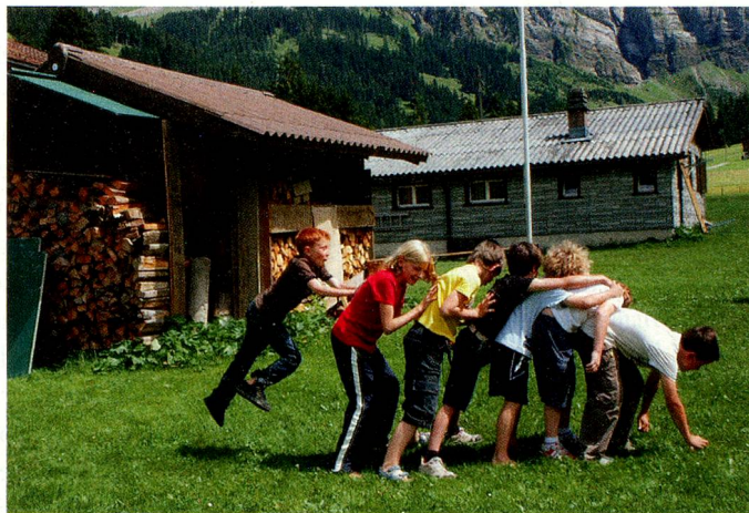
Sommerlager in Adelboden.

1.8.-12.8.09: Swisstrip für 20 Jugendliche von 12 bis 16 Jahren