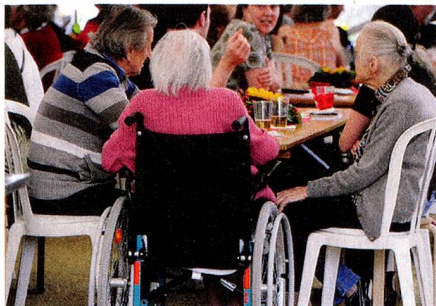
Der Anteil alter Menschen an der Bevölkerung wird immer grösser

rung des Risikoausgleichs zwischen den Kassen: Bundesrat Berset verfolgt nach dem Scheitern der gross angelegten Reformen der letzten Jahre eine Politik der kleinen Schritte. Entscheidend wird sein, ob es