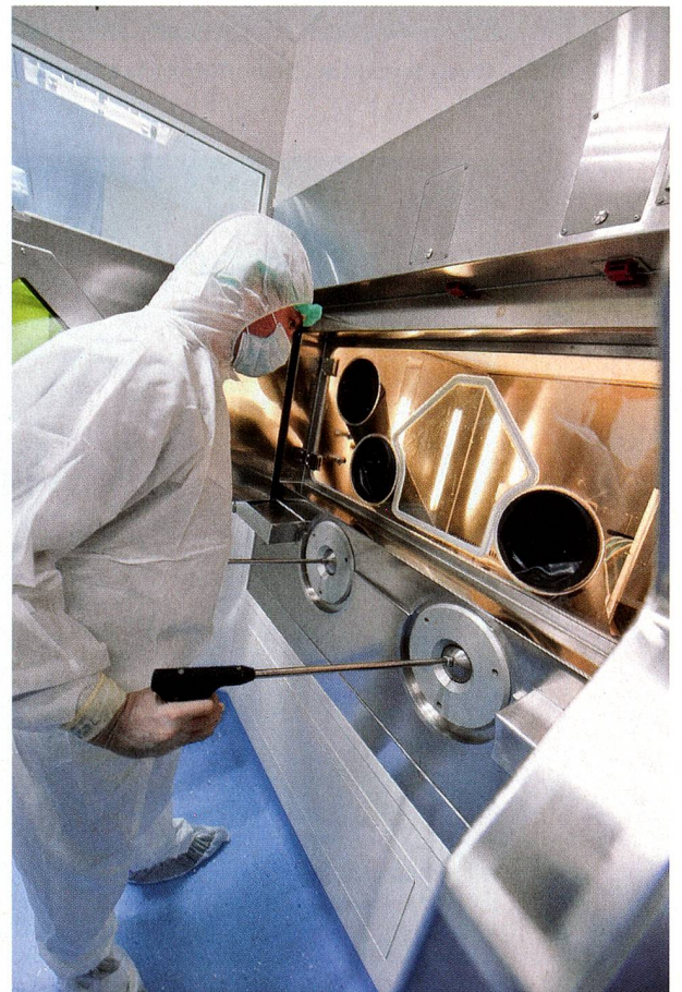
Hochtechnisierte Spitzenmedizin verursacht immense Kosten

Die Blockade bei der Gesundheitspolitik hat verschiedene Gründe. Einer liegt darin, dass man sich in einem grundsätzlichen Punkt nicht einig ist: Was braucht das Gesundheitswesen? Mehr Markt oder mehr Staat? Das bürgerlich dominierte Parlament neigt eher zu wettbewerblichen Modellen, doch die Bevölkerung ist skeptisch. Das Scheitern der vom Parlament ausgearbeiteten Managed-Care-Vorlage im vergangenen Juni ist ein deutliches Beispiel. Dafür stehen die Chancen nicht schlecht, dass die Initiative der SP für eine Einheitskrankenkasse vom Volk angenommen wird. Auch hier