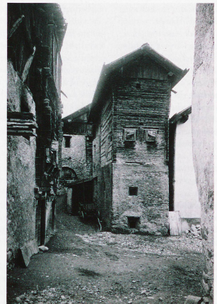
Wohnhaus in Zuoz, fotografiert von Rudolf Zinggeler

SCHWITZER KUPFER, Bild: 2012, 16 x 21 Foto: Zingeler, Kunstmuseum