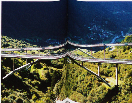
Ponte Nanin und Ponte Castella in Mesocco, fotografierter Anfang des 20. Jahrhunderts von Ralph Feiner