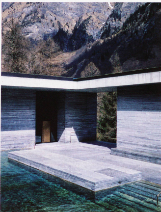
1996 eröffnete Neubau der Therme Vals von Architekt Peter Zumthor, fotografiert von Hélène Binet