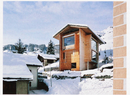
Vom Architekten Peter Zumthor erbautes Haus in Leis, fotografiert 2012 von Ralph Feiner