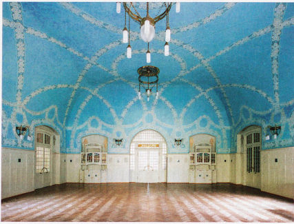
Speise- und Ballsaal des 1906 eröffneten Kurhauses Bergün, fotografiert 2009 von Ralph Feiner

Ausstellung: bis 12. Mai 2013 im Bündner Kunstmuseum Chur. www.buendner-kunstmuseum.ch Buch: «Ansichtssache». 150 Jahre Architektur fotografie in Graubünden. Hrsg: Stephan Kunz und Kobi Gantenbein. Verlag Scheidegger & Spiess / Bündner Kunstmuseum. 384 Seiten; CHF 58.–, Euro 48.–