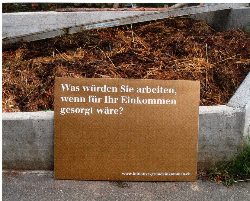
Die Antwort könnte schwierig sein

Am 4. Oktober 2013 soll es in Bern ein Fest geben: Die Initiantinnen und Initianten laden ein, einem «historischen Ereignis» beizuwohnen. Sie wollen dann die mindestens 100 000 Unterschriften ihrer Volksinitiative für ein Bedingungsloses Grundeinkommen bei der Bundeskanzlei einreichen. Das Thema ist nicht nur in der Schweiz aktuell, auch in der EU werden Unterschriften für eine EU-Bürgerinitiative (nicht vergleichbar mit der schweizerischen Volksinitiative) gesammelt. Der Titel lautet dort: «Bedingungsloses Grundeinkommen (BGE) – Erforschung eines Weges zu emanzipatorischen sozialstaatlichen Rahmenbedingungen in der EU.»