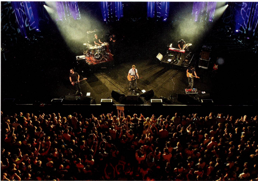
Beim grossen Auftritt im Auditorium Stravinski in Montreux

Konzert nach dem anderen. Er tritt in Deutschland, Moskau, New York und Los Angeles auf, es ist klar, wo seine Ambitionen liegen. «Ich würde gern den Durchbruch in Russland schaffen, in einem Markt, der in der Schweiz allen egal ist. Russland interessiert kaum jemanden. Das reizt mich.»