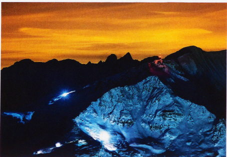
Pistenfahrzeuge und Schneekanonen am Corvatsch, aufgenommen vom Piz Nair, 12. Dezember 2012