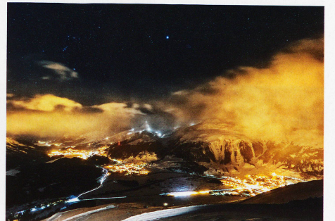
St. Moritz, Celerina und Samedan, aufgenommen von Muottas Muragl, 9. Februar 2013