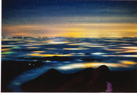
Nebelmeer über dem Mittelland, aufgenommen vom Säntis, 24. November 2011