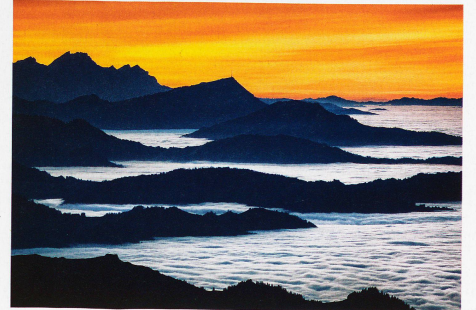
Nebelmeer über den Voralpen, mit Pilatus und Rigi, aufgenommen vom Säntis, 24. November 2011