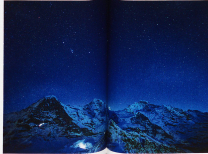
Sternbild Orion über Eiger, Mönch und Jungfrau, aufgenommen vom Männlichen, 31. Januar 2011