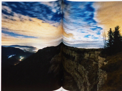
Creux du Van, aufgenommen am 20. November 2011