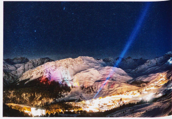
Silvesternacht in Arosa, aufgenommen von Tschuggen, 1. Januar 2012

Buch: «Helvetia by night» Verlag NZZ Libro, Zürich, 2013; 192 Seiten, 100 Abbildungen mit fototechnischen Erklärungen im Anhang, CHF 84.– Mehr unter: helvetiabynight.com/