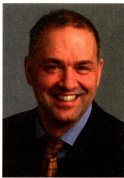
Der Autor Gerhard Lochmann ist Rechtsanwalt in Emmendingen bei Freiburg im Breisgau.

Dabei ist die neue Steuerrechtslage nach dem Alters-einkünftegesetz, das zum 1.1.2005 in Kraft getreten ist, zu berücksichtigen. Es brachte das System der nachgelagerten Rentenbesteuerung mit der Folge, dass auch kapitalisierte Einmalzahlungen aus einer Schweizer Pensionskasse (Freizügigkeitsleistungen) grundsätzlich einkommensteuerpflichtig sind. Sie werden wie laufende Rentenzahlungen der Pensionskasse, aber nur mit dem Besteuerungsanteil angesetzt. Der Rentenfreibetrag beträgt je nach Renteneintrittsalter fallend etwa für 2010 vierzig Prozent, für 2020 zwanzig Prozent und fällt ab 2040 weg. Der zu besteuerte Anteil der Auszahlung unterliegt dann der Einkommensbesteuerung mit den entsprechenden Progressionsnachteilen im Jahr der Zahlung. Das Einkommen erhöht sich um den zu versteuernden Zahlungsbetrag und schnell ist der Grenzsteuersatz der Einkommensteuer von 42 Prozent erreicht (bei einem zu versteuernden Einkom-