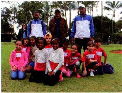
Crianças que participaram da Copa Suíça

O evento, tanto para os participantes adultos como para as crianças, foi um grande sucesso, e a Embaixada da Suíça espera poder voltar em breve com uma nova edição.