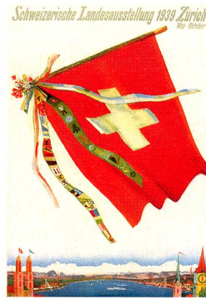
Plakat für die Landi 1939 in Zürich