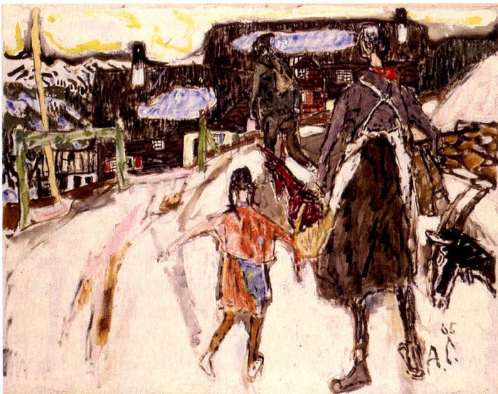
Die Bergbauernfamilie (1965), Öl auf Leinwand

Nun, zum 30. Todestag von Alois Carigiet (1902 – 1985) und zum 70. Geburtstag von «Schellen-Ursli» würdigt das Landesmuseum in Zürich das Werk Carigiet. Der Titel der Ausstellung «Alois Carigiet. Kunst, Grafik und Schellen-Ursli» zeigt, dass der Bündner Maler für sein Werk als Grafiker, Bühnenbildner und Maler ebenso grosse Beachtung verdient wie für seine Bilderbücher. Zur Ausstellung ist das Buch «Alois