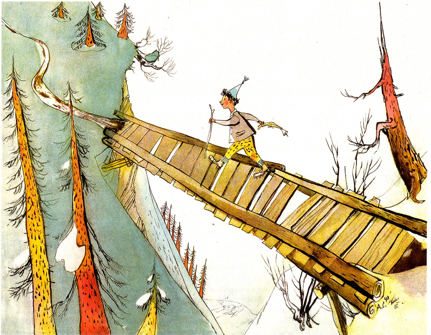
Schellen-Ursli auf dem Weg zur Alphütte