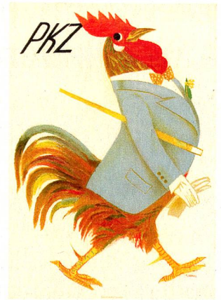
Plakat für PKZ (1935)