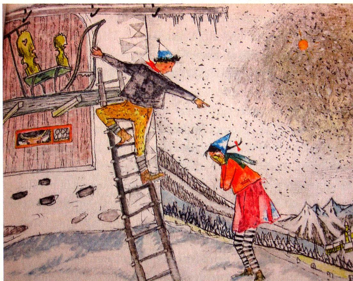
Aus dem Buch «Flurina und das Wildvöglein»