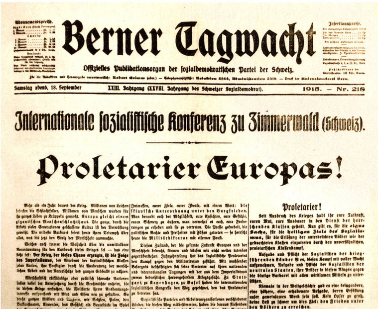
Der Bericht in der lokalen Zeitung der Sozialdemokraten