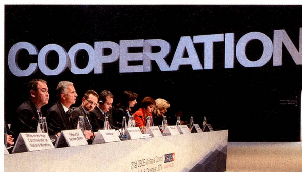
Tisch des Vorsitzes im Ministerratsaal

Für weiterführende Informationen das Web-Dossier des Schweizer Vorsitzes 2014: www.eda.admin.ch/eda/de/home/aktuell/dossiers/osze-vorsitz-2014.html