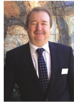
Peter Zimmerli, EDA-Delegierter für Auslandschweizerbeziehungen.