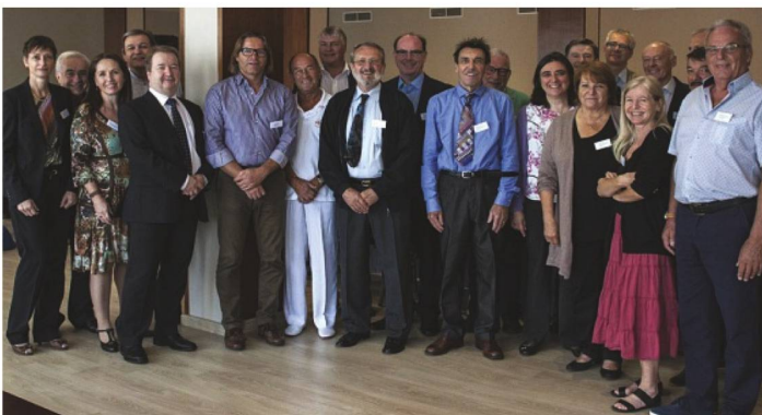
Klassenfoto: Die versammelten Teilnehmer der Präsidentenkonferenz 2015.