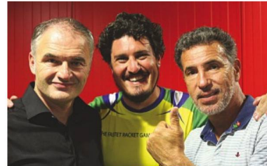
O representante da associação Miratus entre as duas lendas do futebol Stéphane Chapuisat e Careca

Faz quase vinte anos que os jogadores de futebol do time dos Manezinhos, de Florianópolis, viajaram pelo mundo e jogaram contra equipes locais em nome da amizade entre os povos. Com mais de 30 países visitados e uma partida jogada, no Ticino, há alguns anos, chegou a hora, para os gloriosos jogadores do estado de Santa Catarina, cruzarem um gramado suíço-francês.