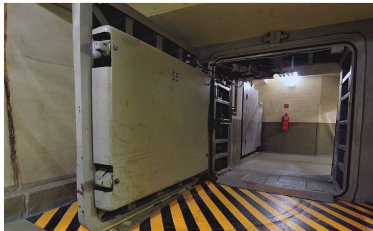
Im Krisen- und Verteidigungsfall hätte der Regierungsbunker im Ahrtal als Ausweichsitz der Bonner Regierung gedient

Die Mitarbeiter des Heimatvereins Alt-Ahrweiler begleiten uns auf einer ca. eineinhalbstündigen Bunker-Führung durch eine unterirdische Welt, die noch bis vor kurzem strenger Geheimhaltung unterlag und erst seit 2008 der Öffentlichkeit zugänglich ist. Der Regierungsbunker im Ahrtal war das geheimste Bauwerk in der Ge-