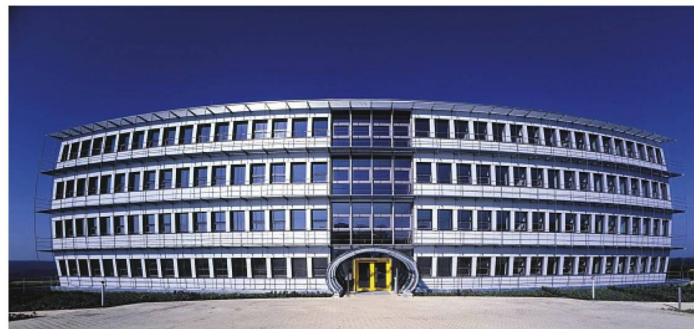
Energion: Das Bürogebäude für ca. 420 Mitarbeiter zapft vorhandene Energien an: Erdwärme, Sonnenenergie und die Abwärme von Computern und Menschen

■ Samstag, 12. Mai um 15 Uhr: Besichtigung des Passivhauses «Energion» auf dem Eselsberg