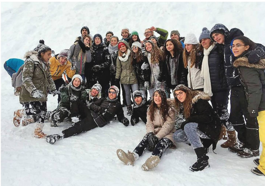
Schülerinnen und Schüler im Schnee: Alpines Vergnügen auf der Grütschalp bei Müren.

zulernen: Sie fuhren nach Zürich, sahen ein Handballspiel und genossen den Schnee in den Alpen. Bei einem Besuch in Genf hörten sie einen Vortrag über Flüchtlingsrechte in den Büros der UNHCR. Danach besuchten sie das Museum des Internationalen Roten Kreuzes. Besondere Highlights waren die Besuche in einer Käse- und einer Schokoladenfabrik in Gruyère.