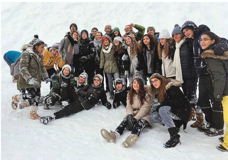
Schülerinnen und Schüler im Schnee: Alpines Vergnügen auf der Grütschalp bei Müren.

zulernen: Sie fuhren nach Zürich, sahen ein Handballspiel und genossen den Schnee in den Alpen. Bei einem Besuch in Genf hörten sie einen Vortrag über Flüchtlingsrechte in den Büros der UNHCR. Danach besuchten sie das Museum des Internationalen Roten Kreuzes. Besondere Highlights waren die Besuche in einer Käse- und einer Schokoladenfabrik in Gruyère.