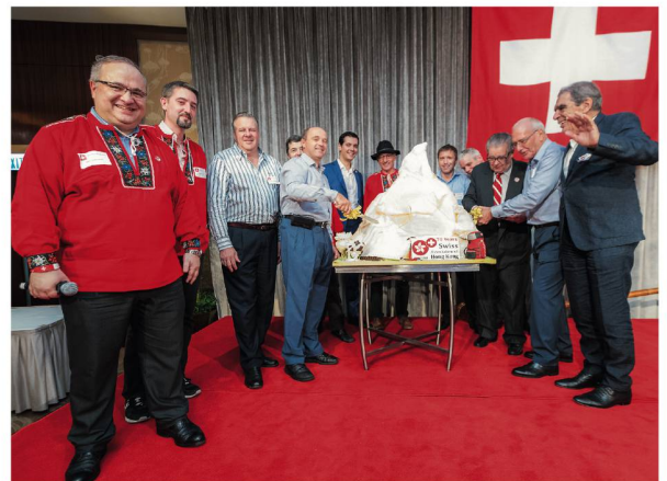
The celebration of the Swiss national day was highlighted by a Matterhorn-shaped cake.