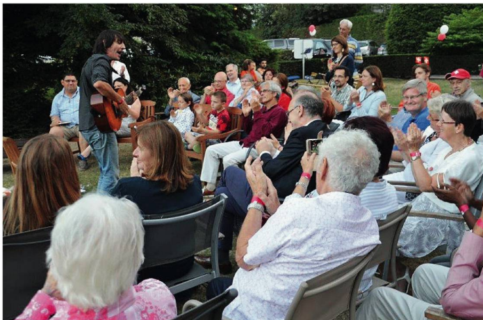
Les invitées écoutent Marc Aymon, un chanteur valaisan.