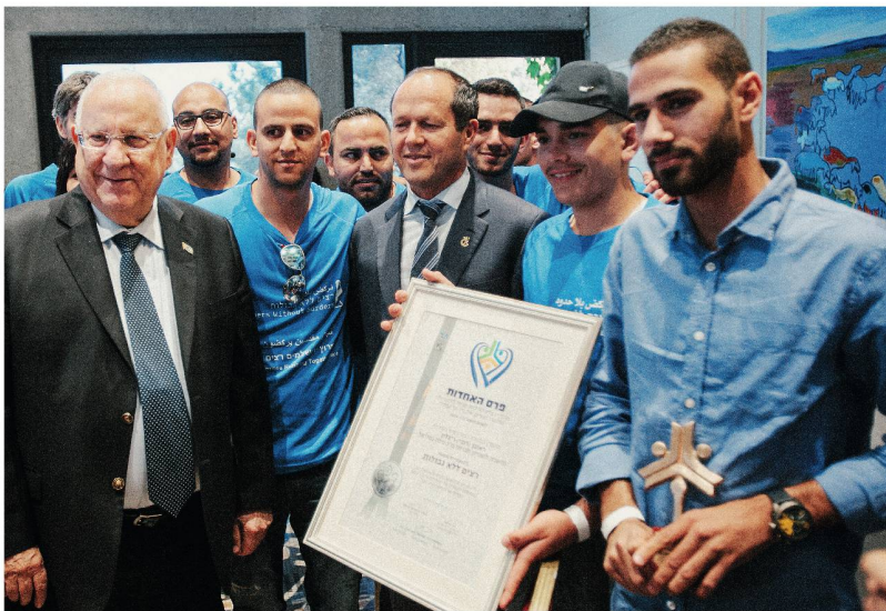
Eine besondere Ehre: Reuven (Rubi) Rivlin, Präsident des Staates Israel (vorne links) und der Bürgermeister von Jerusalem, Nir Barkat (Mitte), verleihen den «Jerusalem Unity Prize».

Laufen ist speziell gut geeignet, denn es verursacht kaum Kosten und erlaubt eine Teilnahme unabhängig der sozioökonomischen Situation. Jugendliche aus ärmeren Nachbarschaften haben oft kaum Kontakt zu