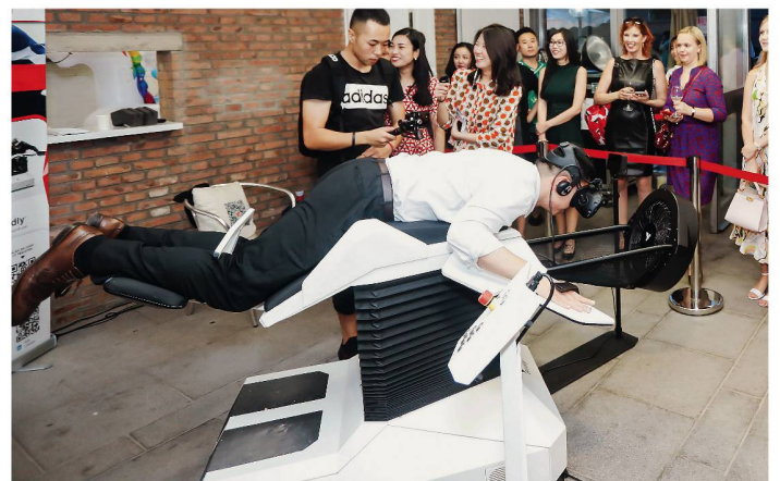
Visitor tries Birdly, a VR simulator for flying.