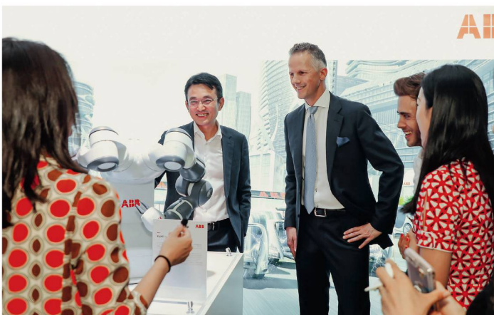
ABB's industrial robot Yumi at Swiss Innovation Week.