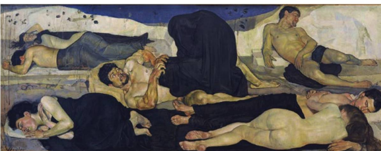
Ferdinand Hodler: «Die Nacht», 1889.