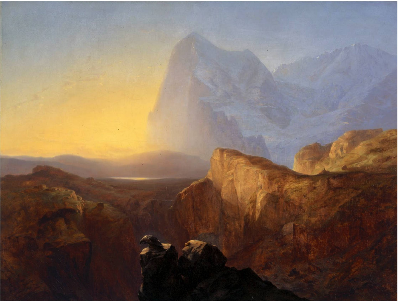
Alexandre Calame: «Le Grand Eiger au soleil levant», 1844.