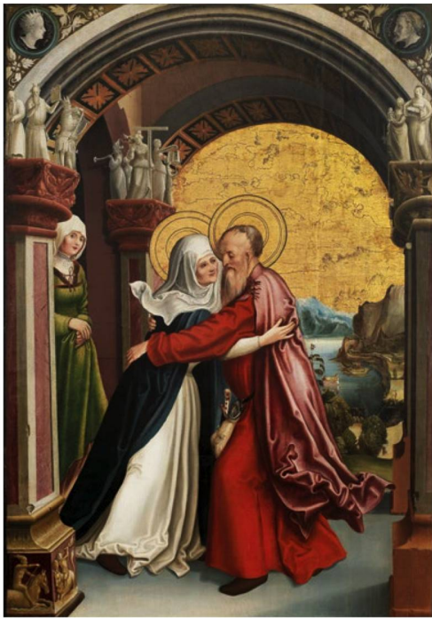
Niklaus Manuel: «Altar der heiligen Anna: Begegnung von Joachim und Anna an der Goldenen Pforte», 1515.