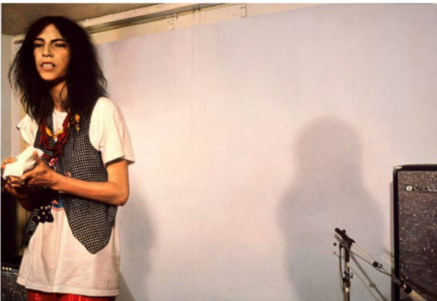
Franz Gertsch: «Patti Smith II», 1978.