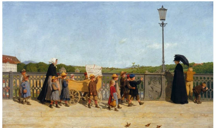
Albert Anker: «Kleinkinderschule auf der Kirchenfeldbrücke», 1900.