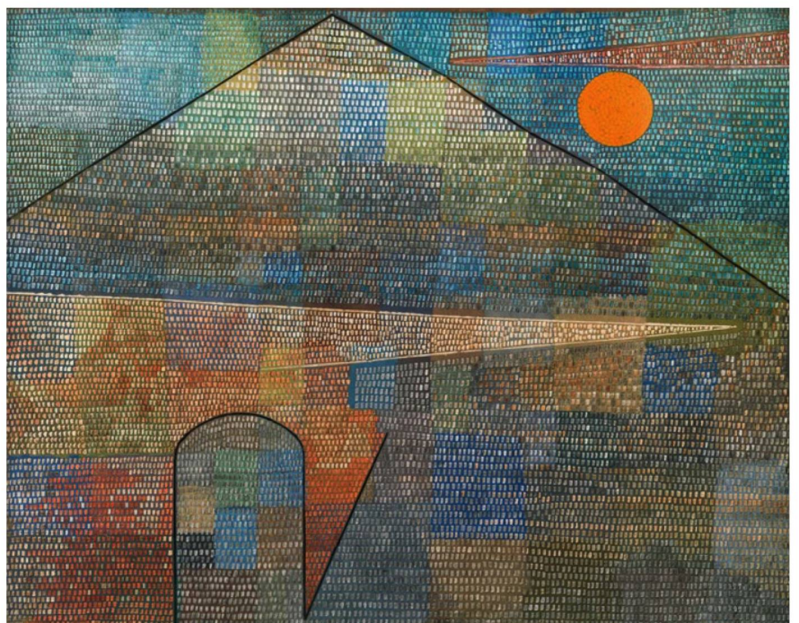
Paul Klee: «Ad Parnassum», 1932.