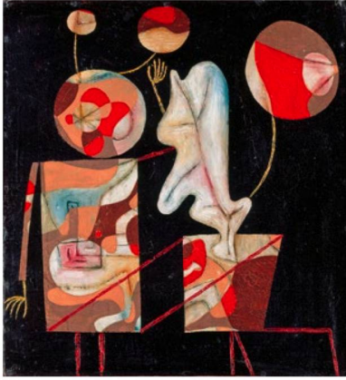
Paul Klee Marionetten, 1930 Öl auf Karton