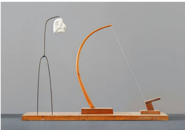
Alberto Giacometti Fleur en danger, 1932 Holz, Gips, Draht und Schnur