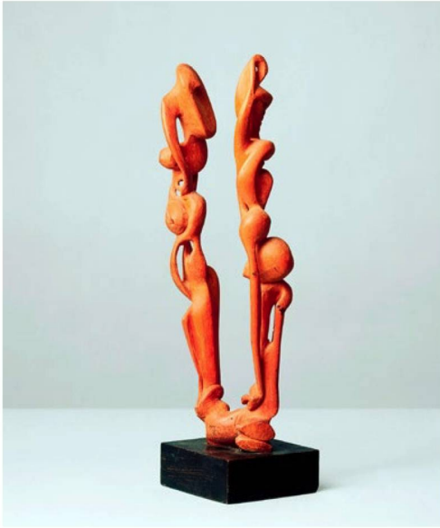
Serge Brignoni Érotique-végétal I, 1933 Holz