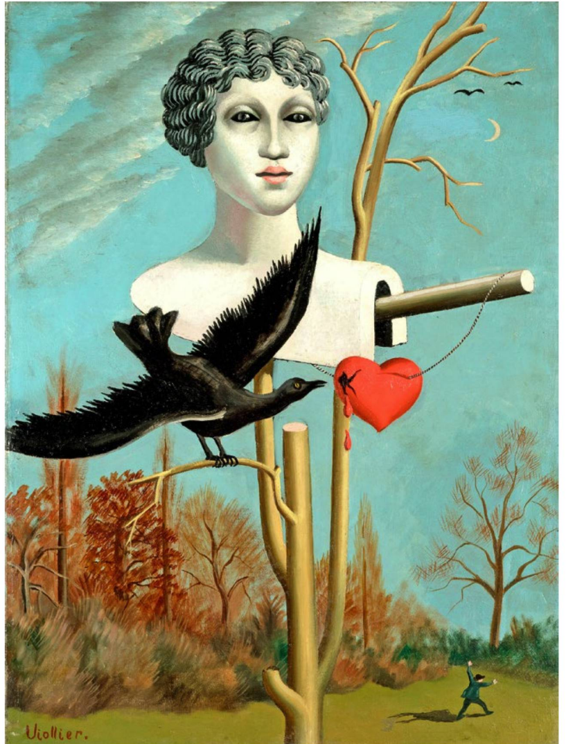
Jean Viollier L'épouvantail charmeur III, 1928 Öl auf Leinwand