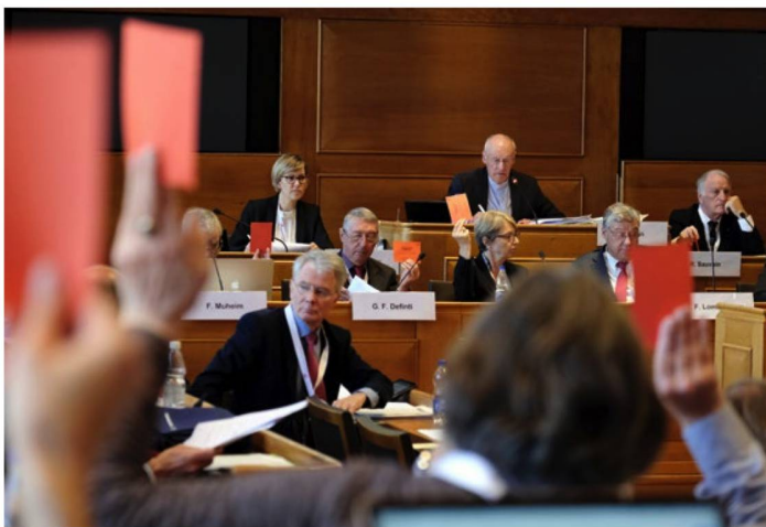
Vielseitiger Ratsbetrieb: In Bern stand für den ASR insbesondere das Wahljahr im Mittelpunkt.

Der ASR vermeidet aber in diesem wichtigen Thema den konfrontativen Kurs. Er verzichtet vorerst auf eine Klage gegen Postfinance. In seiner in Bern verabschiedeten Resolution nahm er aber klar Stellung: «Wir, die Auslandschweizerinnen und Auslandschweizer, verlangen einen diskriminierungsfreien Zugang zu den Leistungen von Postfinance.» (ASO)