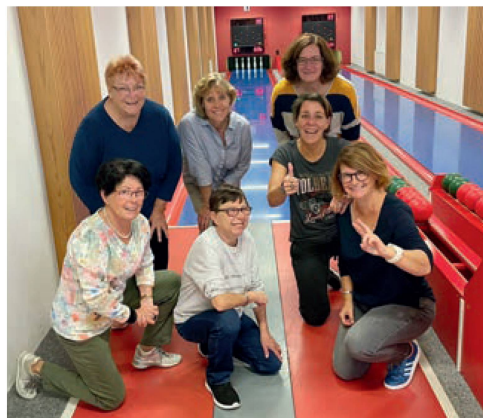
Die Kärntner Frauen kämpften wacker ...

Die am (Corona-bedingt momentan leider sehr eingeschränkten) Geschehen unseres Vereins interessierten Leserinnen & Leser werden gebeten, sich auf unsere Webseite www.swissclub.cz zu begeben. Herzlichen Dank im Voraus für Ihren Besuch dort und viel Vergnügen bei der Lektüre.