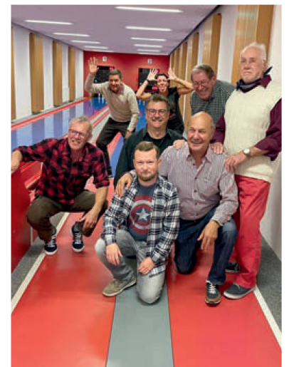
... aber es gewonnen (noch) die Männer