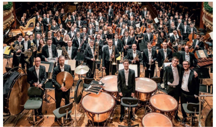
Im Februar ist das OSR in Spanien auf Tournee. - L'OSR sera en tournée en Espagne au mois de février.

En 1918, le chef d'orchestre Ernest Ansermet, né à Vevey, fonde l'«Orchestre de la Suisse Romande – OSR», qui fait aujourd'hui partie des institutions culturelles ancrées en Suisse romande avec ses 112 musiciennes et musiciens professionnels. L'orchestre donne régulièrement des concerts à Lausanne et à Genève, enchante l'ONU avec un concert annuel et se produit fréquemment à l'internationale en tournée en Asie, aux États-Unis et en Europe. Connu pour sa connaissance de la force, de la clarté et de la profondeur des travaux de Gustav Mahler, le chef d'orchestre britannique Jonathan Nott dirige l'OSR tant musicalement que culturellement depuis 2017.