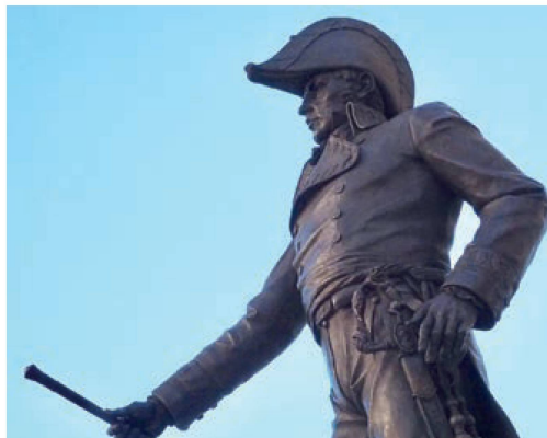
In Málaga steht eine Statue zu Ehren des Schweizer Militärführers. Une statue à la gloire du général suisse se trouve à Málaga.