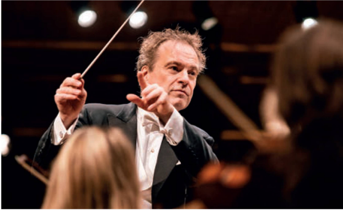
Das Orchestre de la Suisse Romande wird vom britischen Dirigenten Jonathan Nott geleitet. L'Orchestre de la Suisse Romande est dirigé par le chef d'orchestre britannique Jonathan Nott.

1918 gründete der in Vevey geborene Dirigent Ernest Ansermet das OSR, welches heute mit seinen 112 fest angestellten Musikerinnen und Musikern zu den festen Kulturinstitutionen der Westschweiz gehört.