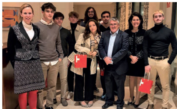
Die Jungbürgerfeier fand im Hotel Westin Valencia statt.. - La fête pour les nouveaux citoyens a eu lieu dans l'hôtel Westin Valencia.

Après avoir dû annuler le lancement début 2021 de sa station mobile de passeports à Valence en raison de la pandémie de Covid-19, le Consulat général de Suisse à Barcelone a enfin pu l'ouvrir en novembre dernier. Près d'une centaine de demandes de cartes d'identité et de passeports ont ainsi pu être saisies et traitées avec succès. Les clubs suisses dans la Comunidad Valenciana et à Murcia ont contribué à la réussite de ce projet en communiquant sur cette action via leurs réseaux de contacts.