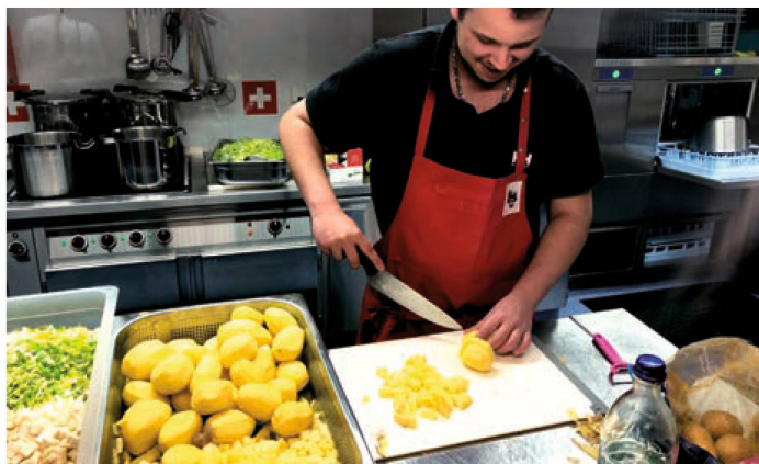
Ein Blick hinter die Kulissen: Bündner Gerstensuppe und Kartoffelsuppe sind in Arbeit.

Auf unserer Locanda zauberten wir mit vielen Tannenbäumen einen Weihnachtswald und luden die Mitglieder zu einem vorweihnachtlichen Nachmittag ein. Selbst gebrauter Glühwein, Bündner Gersten- und Kartoffelsuppe, die frisch von zwei jungen Köchen in unserer Küche zubereitet wurden, sorgten für die nötige Unterlage. Die musikalische Umrahmung durch zwei Hornisten, die wir bei den Münchner Philharmonikern ausgeliehen hatten, gab dem Nachmittag die spezielle Note. Nachdem alle Glühwein-