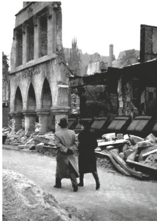
Münster lag 1945 in Trümmern. Hier der Prinzipalmarkt.

Von Bedeutung ist, dass die Journalisten aus einem vom Krieg verschonten Land kamen und die Zerstörung der Städte und die Not mit anderen Augen betrachteten. Vom grossstädtischen Alltag könne sich niemand einen Begriff machen, der nur den schweizerischen Lebensstil kenne. Auch Beschreibungen würden da nicht weiterhelfen, heisst es im August 1946 im «Walliser Boten». Obwohl einige Autoren zugaben, dass man sich an das Bild der zerstörten Städte gewöhnen könne, weil Not und Elend überall gleich seien, so habe sie das Gesehene doch sehr belastet. Aber dies allein war es nicht, was die Journalisten niederdrückte. Hoffnungslosigkeit und wenig Vertrauen in eine Besserung der Verhältnisse kamen hinzu. Bei Überschreitung der Grenze in Basel sei ein Alpdruck von ihm gewichen, bekennt ein Journalist im August 1946. Er ist mit seiner Meinung wahrlich nicht allein.