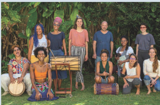
Participantes da residência

Os residentes participaram de imersões para pesquisa e experimentação no espaço urbano do Rio de Janeiro e no Laboratório de Atividades do Amanhã no mês de maio. Fizeram parte do grupo interdisciplinar que trabalhou nas trocas entre arte e ciência para além dos projetos individuais de cada artista: