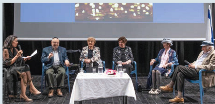
Aktiver Austausch und Unterstützung im Alter: Café-Europa-Programme werden von Shoa-Überlebenden sehr geschätzt.

ein und die Sozialarbeiterinnen besuchen jene zu Hause, die nicht an den wöchentlich stattfindenden kulturellen Programmen teilnehmen können.