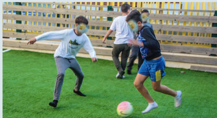
Spiel und Spass in der Sportanlage des Kinderhauses im Stadtviertel Gilo. Aus Gründen des Persönlichkeitsschutzes sind die Gesichter der Kinder auf dem Bild unkenntlich gemacht.

Das Café-Europa-Programm für Shoa-Überlebende wird ebenfalls aus der Schweiz gefördert. In Jerusalem leben über 10 000 Holocaust-Überlebende. Vereinsamung ist im Alter bekanntlich ein allgemeines Problem, bei diesen Menschen kommen jedoch die schrecklichen Erinnerungen aus der Kindheit hinzu. Die sechs Café-Europa-Lokalitäten gehen auf die Bedürfnisse der jeweiligen Stadtviertel