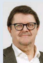
IVO DÜRR, REDAKTION