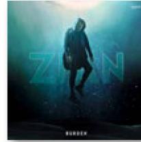
ZIAN: «Burden». Sony, 2022.

Er kam aus dem Nichts und legte über Nacht einen der grössten Schweizer Hits des letzten Jahres vor. Der Song hiess «Show You», der Sänger nennt sich Zian. Doch wer ist dieser Newcomer, von dem zuvor niemand gehört hatte?