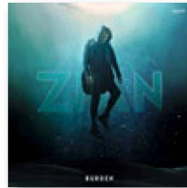
ZIAN: «Burden». Sony, 2022.

Er kam aus dem Nichts und legte über Nacht einen der grössten Schweizer Hits des letzten Jahres vor. Der Song hiess «Show You», der Sänger nennt sich Zian. Doch wer ist dieser Newcomer, von dem zuvor niemand gehört hatte?