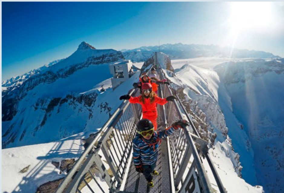
Eine exklusive Ferienlagererinnerung: die Passage auf dem «Peak Walk», der zwei Berggipfel verbindet.

Vom 2. bis 8. Januar 2023 verbringen 13- und 14-Jährige aus der ganzen Schweiz eine Schneesportwoche an der Lenk im Berner Oberland. Unter den 600 Ausgelosten werden 25 Auslandschweizer:innen sein.