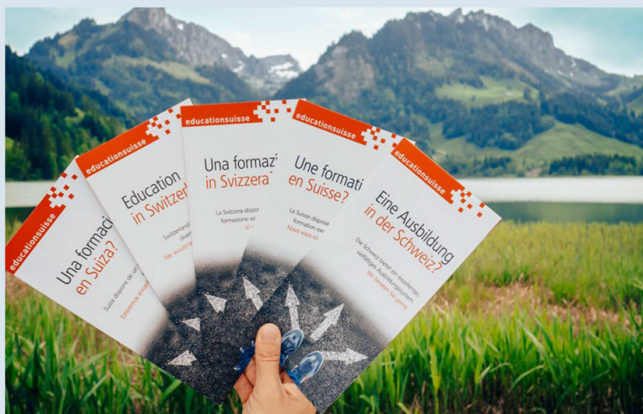
Informationsmaterialien zur Ausbildung in der Schweiz sind in etlichen Sprachen erhältlich.