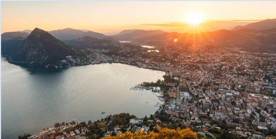
Eine einladende Umgebung für den Kongress: Abendstimmung am «Golf von Lugano».

Wie fordern die grossen Themen der Gegenwart das demokratische System der Schweiz heraus? Diese Kernfrage des Auslandschweizer-Kongresses war wohl nie aktueller als heute. Jenen, die am 19. und 20. August 2022 am Kongress in Lugano mitwirken, wird es nicht an Diskussionsstoff mangeln.