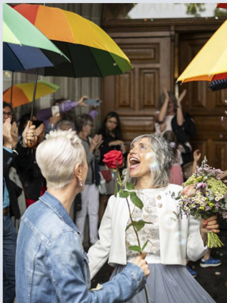
Die «Ehe für alle» hat nicht rein symbolischen Charakter: Verheiratete Paare sind gegenüber eingetragenen Paaren in vielen Belangen bessergestellt.

Die eingetragene Partnerschaft lässt sich mit einer einfachen Erklärung in eine Ehe umwandeln. Sie können diese Umwandlungserklärung auf der für Sie zuständigen Schweizer Vertretung einreichen. Auf Wunsch kann auch eine Trauung mit vorgängigem Ehevorbereitungsverfahren beantragt werden. Dies hat den Vorteil, dass Sie den Namen bei der Trauung ändern können. Beim Umwandlungsverfahren kann eine Namensänderung zwar