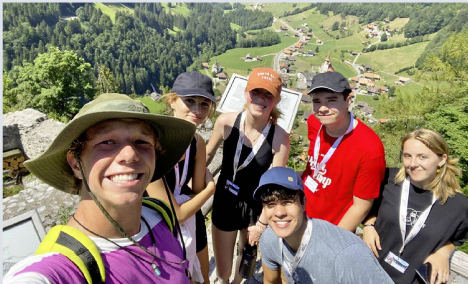
Nach einem Aufstieg ist die Aussicht umso schöner.

Mit wunderbaren Erinnerungen an die diesjährigen Sommerferienlager bereiten wir im Jugenddienst der Auslandschweizer-Organisation (ASO) nun die Angebote für das kommende Jahr vor. So viel ist bereits heute klar: Wir freuen uns, wiederum verschiedene spannende Ferienlager in der Schweiz und den Online-Kongress in Zusammenarbeit mit dem Auslandschweizer Jugendparlament YPSA ausschreiben zu können.