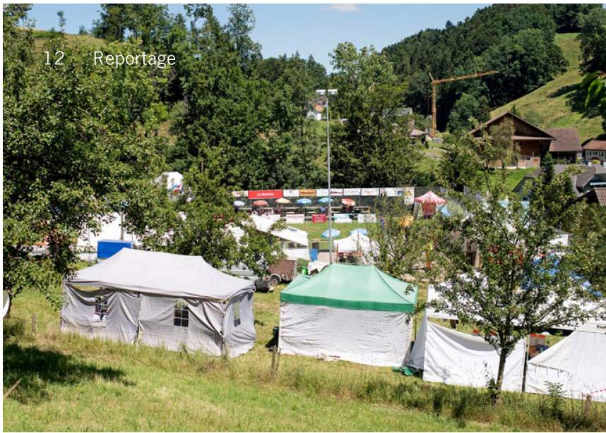
Von Zelten gesäumte Arena Ebersecken im Luzerner Hinterland (Bild links): endlich wieder Seilziehfest.