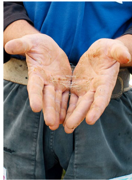
Klebriges Hilfsmittel: Um das Seil besser greifen zu können, reiben die Athletinnen und Athleten ihre Hände mit Harz ein. (Bild rechts).