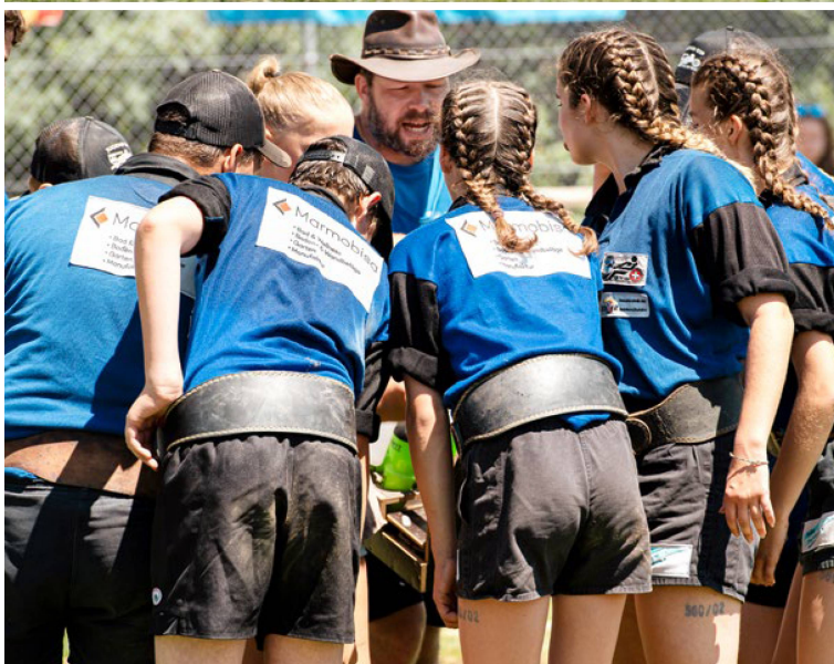
Kraftstrotzende Zielstrebigkeit, neckische Hüte: das Herrenteam in der Kategorie 580 Kilogramm am Heimturnier (oben).