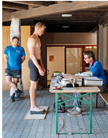
Das Mannschafts- gewicht muss stimmen und wird vor dem Wettkampf bei allen kontrolliert.