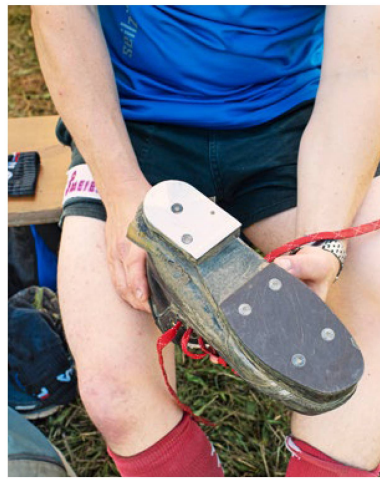
Die Schuhe sind Spezialanfertigungen. Eine Metallplatte am Absatz ist erlaubt.