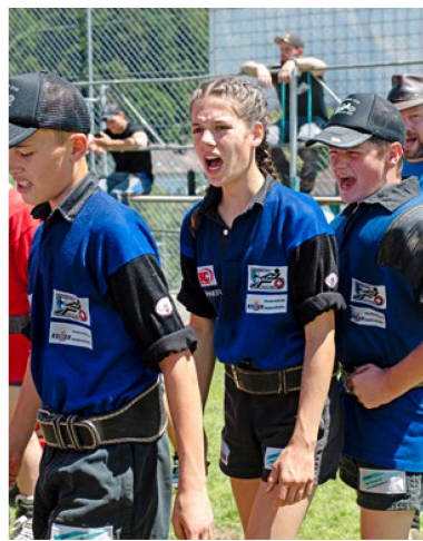
Bereit zum Siegen: Der Ebersecker Seilzieh-Nachwuchs beim Einlaufen.

Austragungsort der WM ist aus Platzgründen der Campus in der nahegelegenen Kleinstadt Sursee. Ein Ziel ist es laut Glanzmann, den Seilziehsport in der Schweiz bekannter zu machen. Während das Schwingen auch in urbanen Kreisen populär und hip geworden ist, wird das Seilziehen wenig beachtet. In Ebersecken selber verwandelt sich der Sportplatz an diesem Juli-Samstag in einen Hexenkessel. Unter ohrenbetäubenden An-