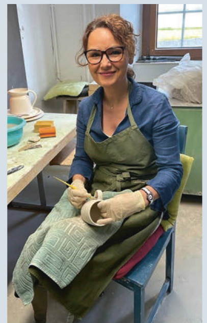
Bei der Herstellung in der Keramikwerkstatt