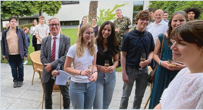
Jungbürgerfeier vom 23. Juni 2023 im Hotel Schatzmann/Restaurant Vivid