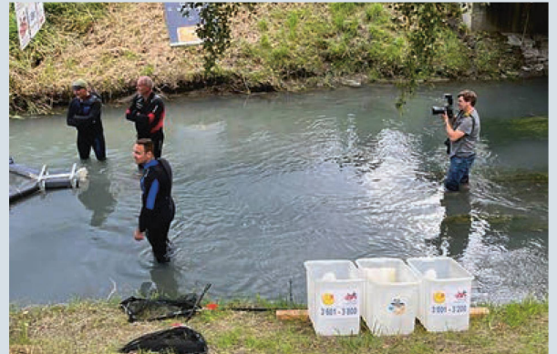
Spannung beim Zieleingang

Um 17.30 Uhr kippte dann ein Bagger am Sandhüslerweg in Triesen die 3000 Plastikenten in den Kanal. Die Rennenten waren dieses Jahr in normalem Tempo unterwegs und die erste Ente erreichte nach 25 Minuten das Ziel. Wiederum fieberten etliche Besucher sowohl beim spektakulären Einkippen der Entchen als auch beim Zieleingang mit und hofften auf einen der vielen schönen Preise für die 25 schnellsten Rennenten. Der erste Preis, einen Reisegutschein in Höhe von CHF 1000.00 des Reisebüro Traveller AG, Vaduz, ging an die