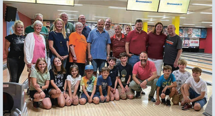
Die Teilnehmenden hatten sichtlich viel Spass