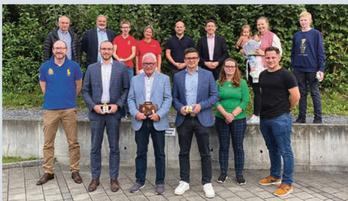
Die Preisübergabe für das Entenrennen fand am 30.08.2023 im LoBistro statt