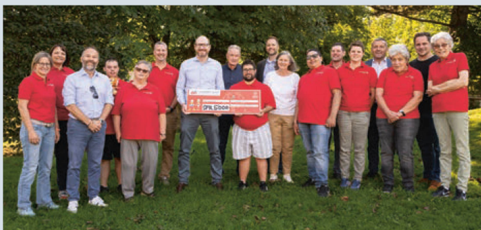
Scheckübergabe an Special Olympics Liechtenstein am 26.09.2023

Besten Dank für die grossartige Organisation und allen zahlreichen freiwilligen Unterstützern für die wertvolle Mithilfe!