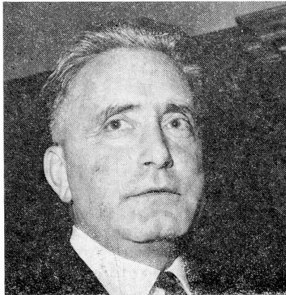
Consejero Federal Sr. G. A. Chevallaz.

tencia médica un "seguro de estadía". Las condiciones pueden solicitarse directamente a las cajas de asistencia médica suizas.