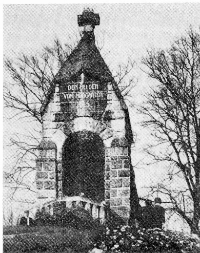
Monumento a orillas del lago de Aegeri, erigido en memoria de la batalla de Morgarten