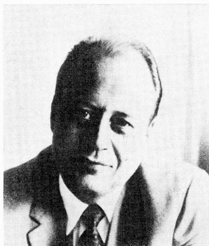
Joël Curchod, director del Servicio Suizo de Ondas Cortas desde 1965.

Existen varias maneras de celebrar un aniversario: con fasto o con discreción, con júbilo o con emoción, con esperanza o con pena. Todo depende de la naturaleza del aniversario y de la persona o institución que se pretende honrar.