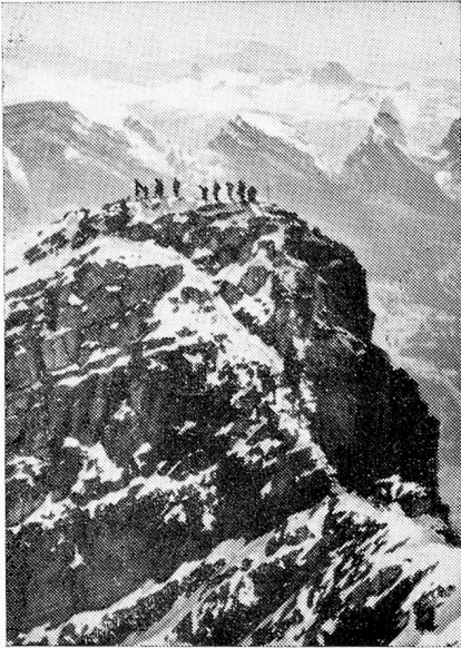
Vista desde el Sântis al Toggenburg y los Churfürsten

sobrenombre: el de "cantón del destino", ya que se trataba de saber si Suiza debía seguir siendo una federación de Estados o convertirse en un Estado federal. Once cantones estaban a favor de la nueva solución, pero se necesitaba la mayoría simple de 22 Estados para decidir. "Douze voix font la loi" declararon los cantones latinos. Con suspenso se esperó en Suiza, así como en el extranjero, el resultado de las nuevas elecciones en el "cantón del destino". Una mayoría ínfima se pronuncia en favor de los liberales, que, con sus aliados de iguales ideas, de los demás cantones suizos, están dispuestos a liquidar, si es preciso con las armas en la mano, al "Sonderbund" adherido al pasado, lo que efectivamente sucedió luego en el conflicto de 1847, conocido como guerra del Sonderbund. Con el Estado federativo de 1848 el cantón de St. Gall colabora adecuadamente. Hasta el presente cinco de nuestros Consejeros federales han salido del cantón (W. Naef, A. Hoffmann, K. Kobelt, Th. Holenstein y K. Furgler). Con satisfacción el cantón aceptó la ayuda federal para las construcciones de canalización