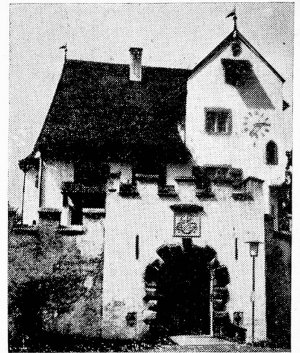
El pequeño castillo A Pro en Seedorf

Cerramos ahora esta breve reseña sobre Uri. Aunque el espacio no ha permitido tocar to-