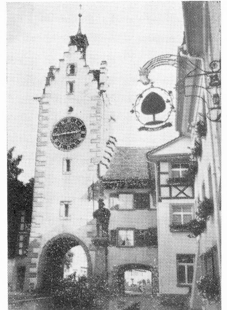
Torre con reloj o sello, construida en 1545 en Diessenhofen

único cantón de Suiza, Turgovia ha conservado la comuna municipal helvética, y con ello un dualismo comunal que no deja de ser interesante. Vale decir que las funciones de la comuna política están divididas, desde la fundación del cantón en 1803, en dos tipos: las que realiza la comuna local y las que competen a la comuna municipal que abarca varias comunas locales. Ambas tienen su función doble: son autónomas, solucionan sus propios cometidos, y por otro lado pertenecen al dominio administrativo del cantón (en especial la mayor, la comuna municipal). Esto tiene por resultado que hay muchos ciudadanos que desempeñan cargos políticos, teniendo de tal modo coparticipación y corresponsabilidad en las decisiones. El interés por los asuntos públicos es vivo. Si a ello se agrega todavía la Comuna escolar supervisada por el Departamento de Educación, que hay Comunas eclesíásticas de ambas confesiones que atienden las necesidades externas de la vida religiosa, que son necesario las circunscripciones para los exámenes finales de las clases superiores de la escuela pública, y de la escuela secundaria, que funcionan las Comunas de Ciudadanos, y recientemente también Uniones comunales para fines específicos, entonces la multiplicidad de Comunas se convierte en freno. Puede suce-