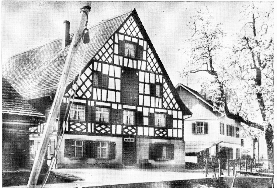
Casa entramada en Ermatingen

ducción se debe la unificación estatal de Turgovia. En el año 1460 el pujante ímpetu de los Confederados incorporó el landgraviato a sus dominios, lo que contribuyó a un breve florecimiento militar y cultural de Turgovia. Como dominio común, el territorio estuvo hasta 1798 sometido a la jurisdicción de uno de los siete Estados de la Confederación, que se alternaban a ese fin cada dos años, y respectivamente de los ocho viejos Estados a partir de 1712. Como contrapeso al Gobernador Federal en el Castillo de Frauenfeld, existía una diputación para defender los intereses de la justicia inferior. También la organización militar de los ocho cuarteles, existentes desde la guerra de los treinta años, permitía al pueblo pronunciarse sobre asuntos políticos. Lentamente se fue formando una conciencia de solidaridad turgoviense, especialmente cuando en 1712 Frauenfeld fue declarada capital. A principios de marzo de 1798, cuando los franceses ya invadían Berna, los Confederados liberaron a Turgovia de su subordinación tal como lo había exigido un Comité regional encabezado por Paul Reinhart. De inmediato la milicia turgoviense