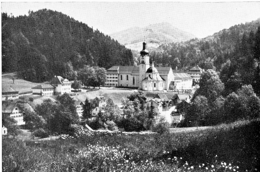
Abadía Benedictina e iglesia barroca en Fischingen

salen las exactas máquinas de coser Bernina, a todo el mundo. Entre las más importantes industrias diseminadas por el valle de Thur, hay grandes molinos, fábricas de cartón y manufacturas de artículos de metal, no debiéndose omitir la mención de una empresa de dimensiones internacionales que elabora productos de esmerilado y amolado. También la Turgovia posterior en el sud, está hoy día más industrializada: fábricas textiles, de muebles, de la industria metalúrgica (parasoles, amoblamientos de cocina) como de la industria química, trabajan allí. En resumen: una colorida paleta!