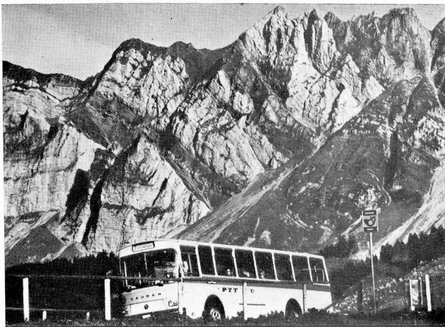
En la "Schwägalp"

Los horarios de los automóviles postales y de los ferrocarriles están naturalmente coordinados. Sobre los trayectos directos de ferrocarril/correo, es posible viajar, en numerosos casos, con un solo boleto o abono. Pero la colaboración entre correo y ferrocarril va más lejos. En la Alta Engadina los ferrocarriles réticos y el servicio postal de viajeros han organizado, por ejemplo, en común, el llamado "Sportbus" que goza de gran popularidad entre los numerosos huéspedes cultores del deporte de invierno y la población nativa. De 8 a 19 horas un coche postal une cada media hora los lugares de vacaciones de la Alta Engadina con las estaciones inferiores de los ferrocarriles de montaña de la región. Un enlace radiofónico con la central de explotación permite una rápida puesta en marcha de servicios complementarios de vehículos. El "Sportbus" permite también al que va de vacaciones prescindir de su propio automóvil y evitarse así la fastidiosa búsqueda de un lugar de estacionamiento. El que adquiere un abono general para la Alta Engadina puede utilizar a la par de los trenes del ferrocarril rético, de los ferrocarriles de montaña, los ski-lifts, las piscinas cubiertas, también el "Sportbus", sin tener que sacar cada vez su monedero.