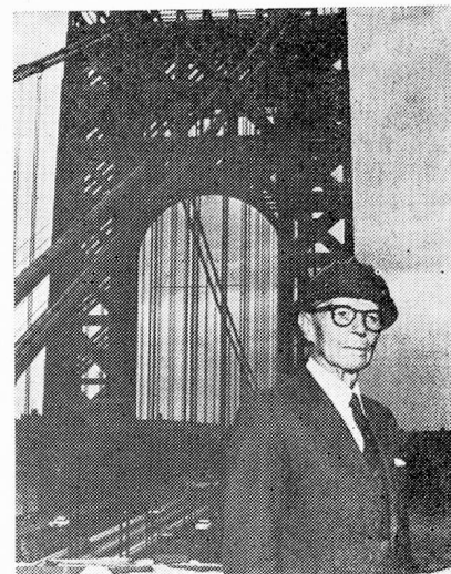
O. H. Ammann delante del puente "George Washington"

Ammann representó al típico emigrado suizo. Agrega al espíritu helvético, hecho de modestia y esmero, de seriedad y sencillez, el afán por solucionar los problemas y dificultades. Donde florecen el gigantismo y el desafío técnico, esta mezcla resulta eficaz. "Por medio siglo de inspiración excepcional en la concepción estética y material de los puentes" recibe Ammann en noviembre de 1964, del Pre-