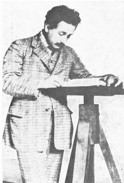
Einstein, 1904, funcionario en la Oficina de la propiedad intelectual, en Berna

Una de las monedas conmemorativas de curso legal