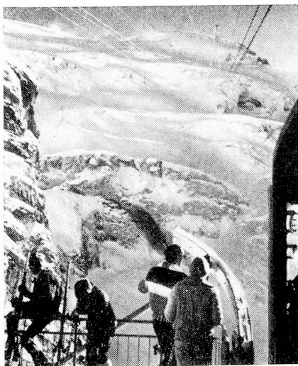
Ski de verano en el Titlis arriba de Engelberg

emperador. En el Museo de Sarnen se pueden ver numerosos documentos de este período dramático.