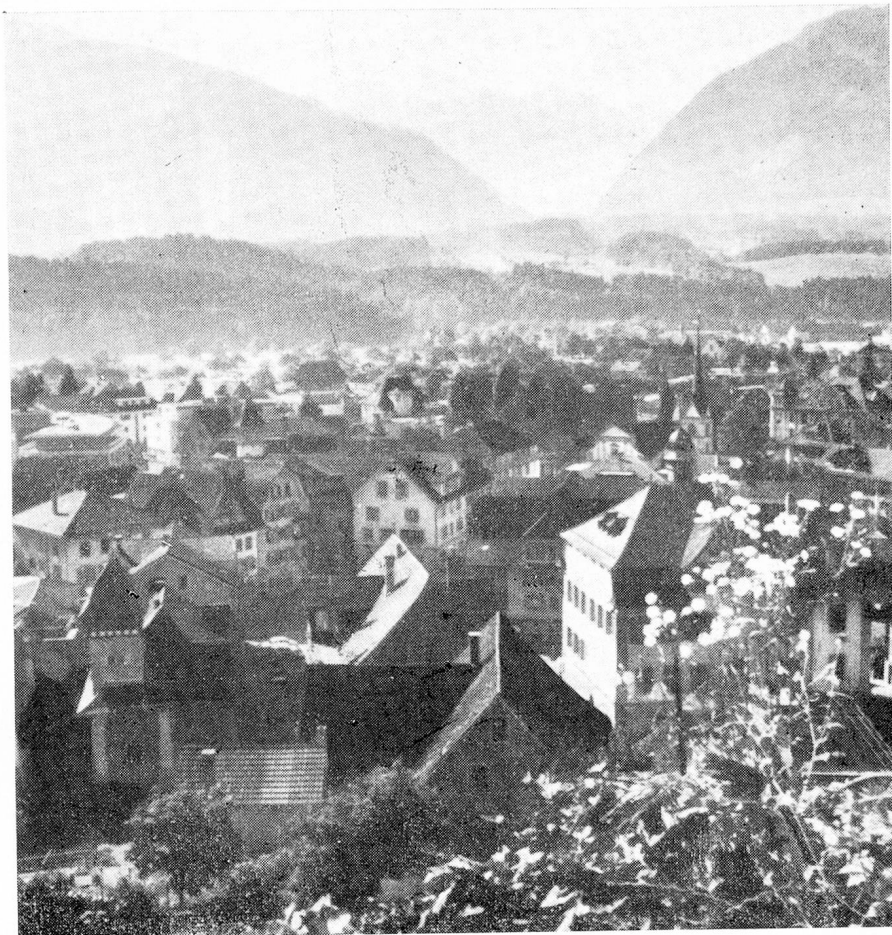
Sarnen, cabecera del cantón de Obwalden

Obwalden ha jugado un papel importante en la historia de la Confederación, participando en todas las guerras suizas. Su gente joven buscó hacer carrera en los ejércitos extranjeros ya que la tierra no producía lo suficiente para alimentar las familias numerosas. En la época de la Reforma, Obwalden se mantuvo fiel a la fe católica. En 1798 los de Obwalden se sometieron al yugo impuesto por Napoleón a Helvecia, empero en su corazón se mantuvieron fieles a las antiguas alianzas, como quedó demostrado a la caída del