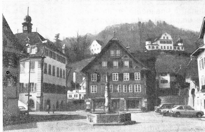
Parte antigua de Sarnen; a la izquierda el palacio municipal; sobre la colina de Landenberg el viejo stand de tiro

ánimos exaltados de los diputados de la Dieta y facilitar el ingreso de Friburgo y de Solothurn a la Confederación, un acontecimiento que será debidamente celebrado el año venidero. Pero si la cólera del pueblo se inflama, entonces la reacción del pueblo es tremenda. La constitución cantonal, aprobada