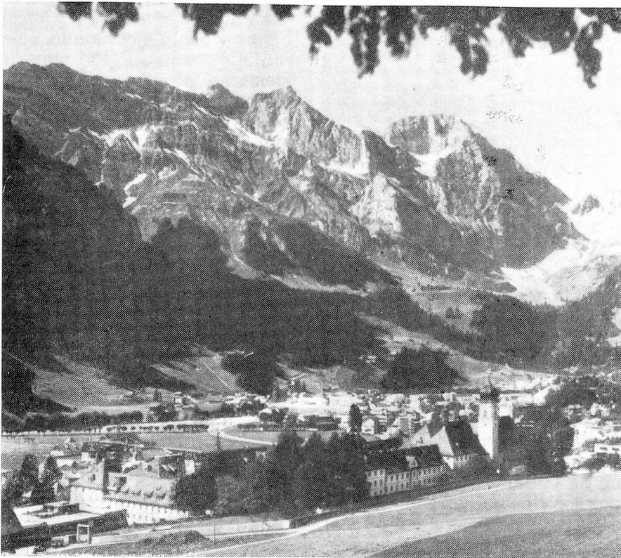
Convento benedictino en Engelberg fundado en 1120