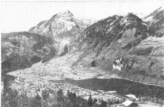
Lungern junto al lago del mismo nombre