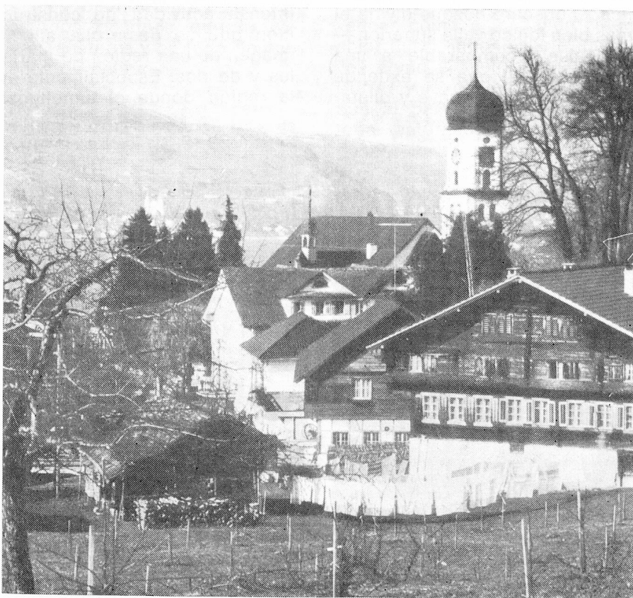
Vista de Sachseln a orillas del lago Sarnen

sos. La biblioteca del Convento de Einsiedeln alberga una gran cantidad de libros ricamente iluminados a mano, del siglo 12, así como una importante colección de obras de arte de la edad media. Entre los cultores modernos del arte literario debe mencionarse ante todo a Heinrich Federer (1866-1928), quien supo expresar las impresiones de su juventud vivida en Sachseln y reflejar poéticamente la imagen del magnífico paisaje de los alrededores del lago de Sarnen, produciendo una obra que retrata en cálido y conmovedor estilo a los hombres y a la tierra de la comarca. En el plano musical el "Jodel" y el "Betruf" (llamado religioso lanzado de una montaña a otra) están presentes desde tiempos inmemoriales. Se cultiva asimismo asiduamente la música folklórica. Numerosos escritores, compositores de música popular y moderna, pintores y escultores, adquirieron un renombre que traspasó las fronteras de nuestro país. Esta escultura típica debe ser cuidada a igual que el paisaje, pues ambos están enraizados entre sí. Se procura proteger y enriquecer el paisaje mediante una cuidadosa división de las zonas de edificación, de praderas y bosques. Y como un primer intento para enriquecer la fauna del cantón se ha procedido a la reintroducción del lince.