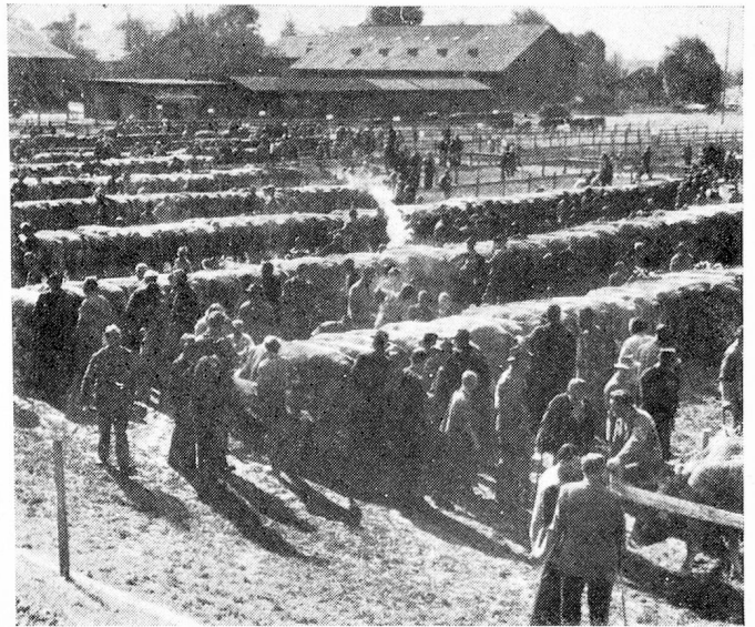
Feria de ganado en Will

avalancha y complejidad de nuevas leyes hacen cada vez más difícil su tratamiento en esta forma, lo que conduce a la oligarquía de una clase dirigente que domina al parlamento central. Tendrá que evitarse asimismo que la Landsgemeinde descienda a nivel de una mera manifestación folklórica. Y aquí hace falta educar, lo que no se descuida. La escuela primaria tiene un ciclo de 9 años de enseñanza. No faltan los modernos edificios escolares. El gimnasio de los Padres Capuchinos en Stans está abierto a varones y mujeres, equivaliendo su enseñanza a la de una escuela secundaria. Para la formación superior se han concertado concordatos con establecimientos educacionales extra-cantoniales, que aseguran a los ansiosos por estudiar suficientes posibilidades de formación en diferentes especializaciones. Solamente aquellos estudiantes de institutos superiores que por contar con becas mínimas, se ven obligados a buscar ingresos adicionales, son los que están en condiciones más desventajosas. En el campo económico se pro-