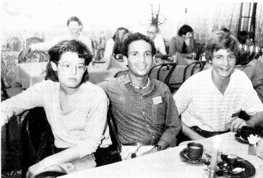
La mesa de los jóvenes