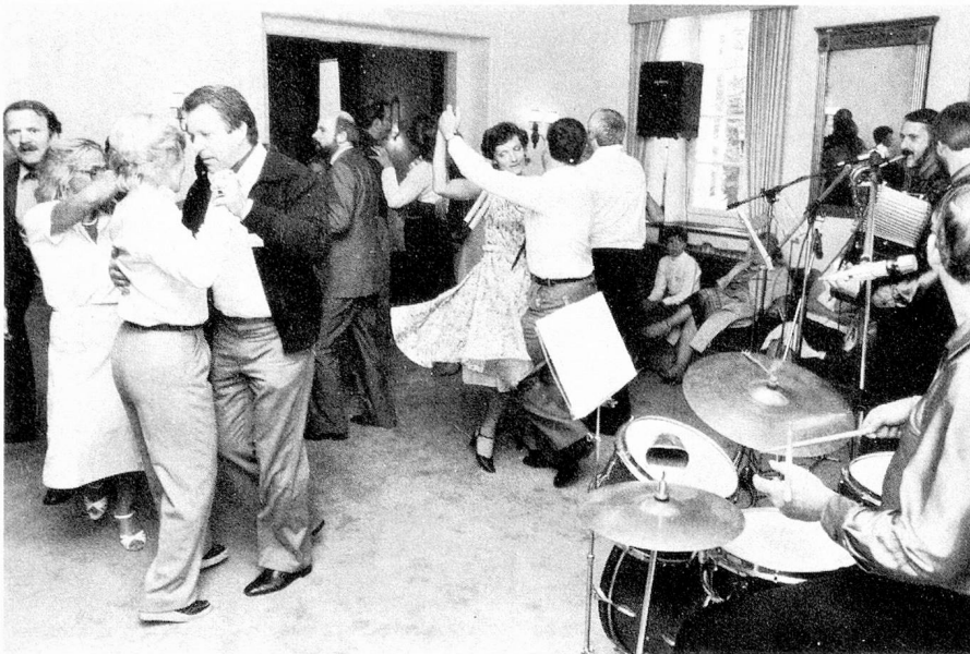
Bailando en Bad Attisholz

«Yo debo admirar siempre de nuevo la energía con que personas de todos los niveles y de todas las edades de nuestro pueblo van al extranjero, para labrarse allí una nueva existencia, desarrollando con toda naturalidad una actividad que muchas veces ellos mismos antes no la hubiesen considerado posible». El Consejo Federal Honegger coincidió asimismo con los Suizos del extranjero en la esperanza de que no sean necesarias nuevas reducciones en las subvenciones en favor de la obra de los suizos del extranjero. El Congreso en Solothurn al cual asistieron unos