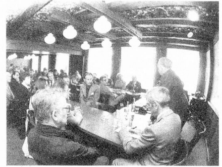
Durante la hora de preguntas

El problema de las escuelas suizas del extranjero ya había sido tratado detenidamente en el 58º Congreso realizado del 22 al 24 de agosto de 1980 en Lugano. Por esto, se renunció a volver a tratar ad longum et latum este tema en Solothurn. Así y todo el presidente de la Organización de los Suizos del extranjero, ex Consejero Nacional Dr. Alfred Weber, en su discurso de apertura de la asamblea plenaria, expresó claramente la decepción que produjo el hecho de que, junto a las escuelas de Florencia, Génova y Nápoles, también se les haya retirado la subvención a dos escuelas que servían principalmente a la formación de niños suizos contratados. La Organización de los Suizos del extranjero mantiene claramente el punto de vista de que éstas escuelas, que permiten a los hijos de quienes han emigrado por tiempo limitado, la reintegración al sistema escolar suizo, son en alto grado dignas de apoyo en virtud de la importancia, que tienen esos emigrantes temporales para la economía exportadora de nuestro país. A la par de la educación de los niños, tienen gran