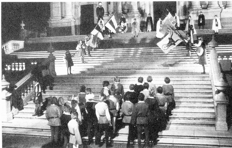
Representación teatral en las gradas de la Catedral