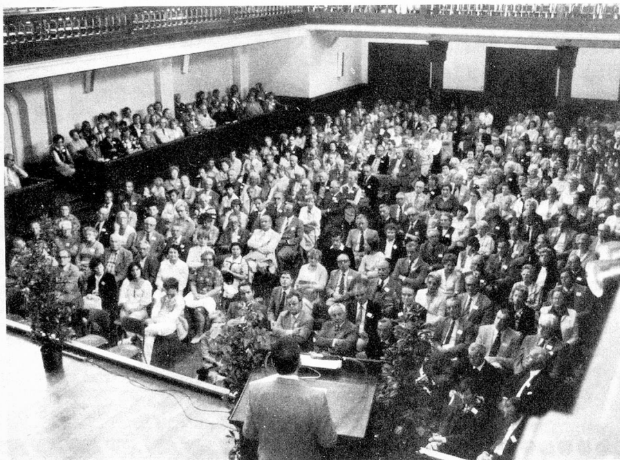
La apertura oficial.

Además de una afiliación sin interrupciones al SVS en Suiza, adquiere también importancia en el caso de un regreso a Suiza, la posibilidad de una