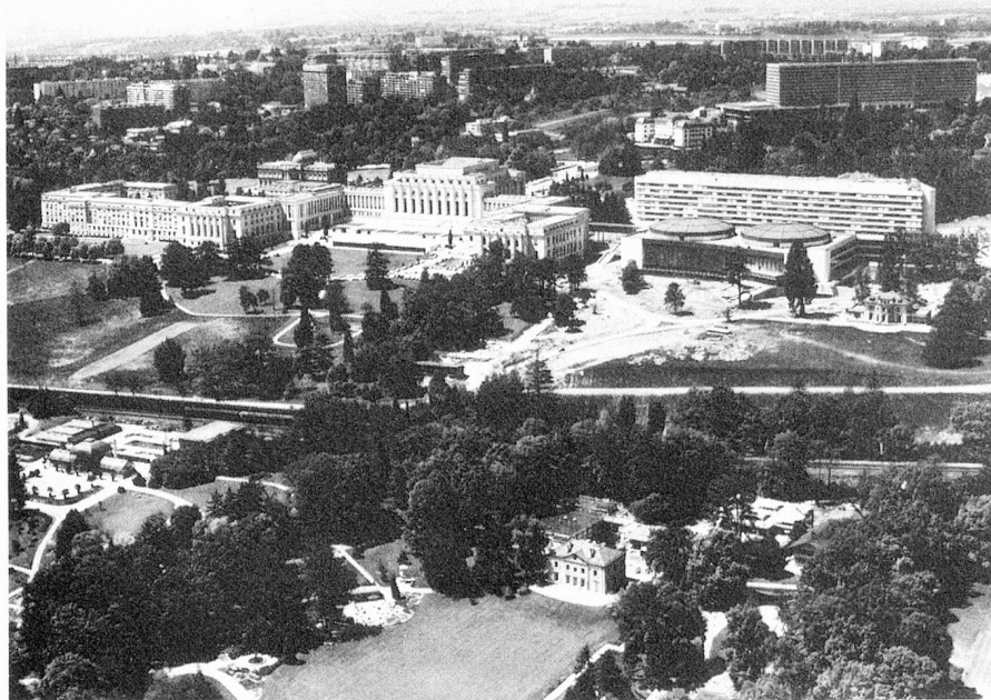
Sede de la ONU en Ginebra

pación en un número restringido de facetas elegidas si queremos realizar un trabajo eficaz a largo plazo. Es necesario tomar parte de una forma continua en los trabajos de las Naciones Unidas con el fin de poder seguir los problemas de principio a fin. También debemos estar en condiciones de reafirmar nuestros puntos de vista y de hacer progresar los conceptos a los que estamos arraigados. Es así que con nuestra ausencia voluntaria de la ONU nos arriesgamos a un aislamiento que solamente puede llegar a perjudicarnos. La razón nos recomienda por lo tanto participar activamente en la cooperación política, económica y social que se está desarrollando en el seno de la ONU. Podemos así poner fin a los inconvenientes resultantes del hecho que nuestra participación esté limitada en varios aspectos. Tendremos la posibilidad de defender mejor nuestros intereses y de presentar directamente nuestra política a la comunidad de los Estados. Esto cobra aún mayor importancia tomando en cuenta que una parti-