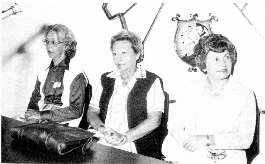
De izq. a der.: Sra. Walz, Sra. Adatte y Sra. Monney

Debido a que llovía torrencialmente, la inauguración oficial del Congreso no pudo realizarse al aire libre, como estaba programado, debiéndose trasladar la misma a la sala del Municipio. La tristeza que por tal motivo amenazaba brotar, fue prontamente disipada por las excelentes y bien logradas representaciones de un grupo de cantores folklóricos valaisanos en sus trajes típicos. Mientras el presidente de la ciu-