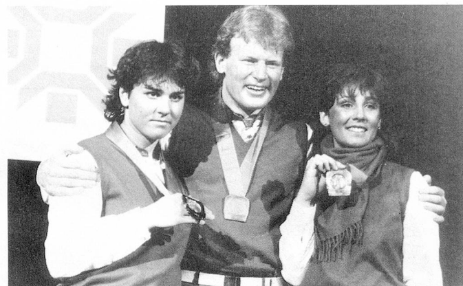
Tres medallas el mismo día (16 de febrero de 1984) para Suiza: de izq. a der. Michela Figini (oro, descenso femenino); Peter Müller (plata, descenso masculino); Maria Walliser (plata, descenso femenino).