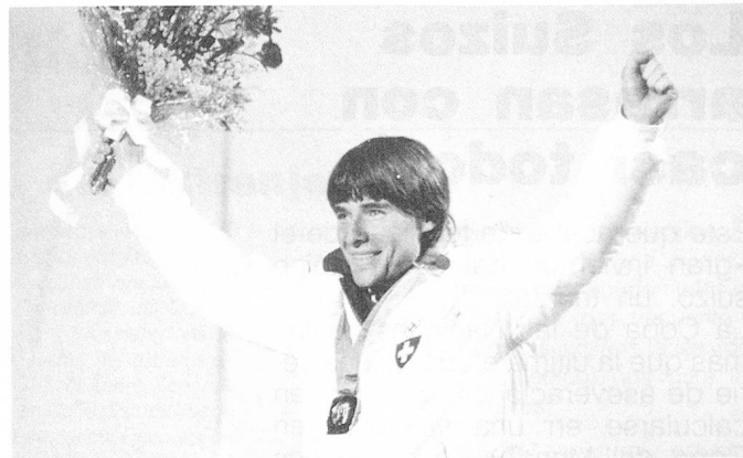
Max Julen, primera medalla suiza de los Juegos de invierno. Ganó la medalla de oro en slalom gigante masculino.