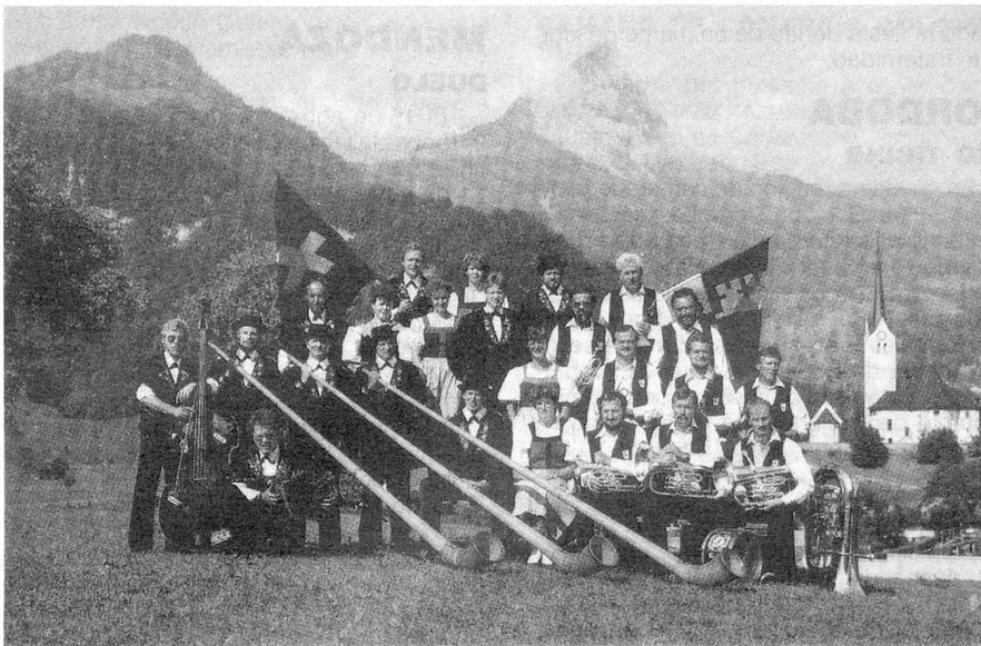
Grupo folklórico de Giswil/Obwalden

Obwalden, los bailes con trajes típicos se cultivan constantemente y se ejecutan generalmente con formaciones de pocos participantes. En el programa hubo algunos de estos bailes así como también el «BÖ-DELE» (zapateo), que es una danza de requiebro y galanteo.