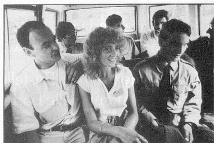
La sonrisa de la juventud