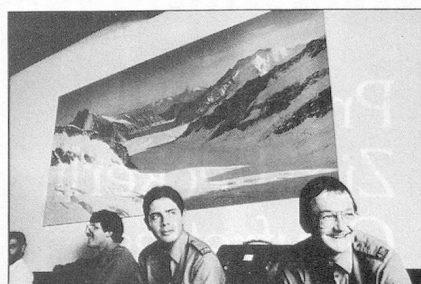
Llegada a la estación