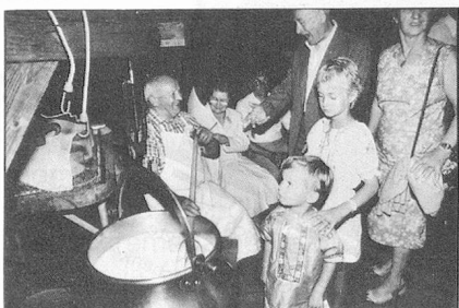
Encuentro en una quesería