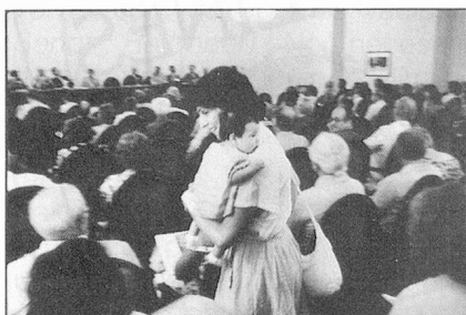
El suizo del extranjero más joven