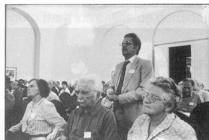
Una pregunta interesante