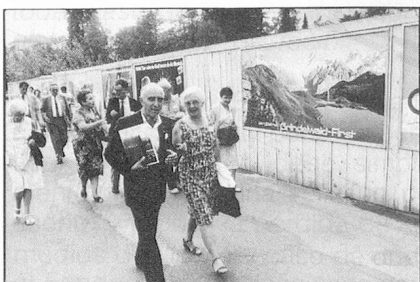
Paseo por la ciudad