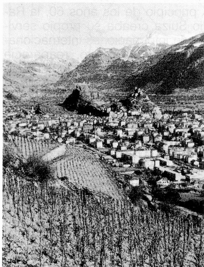
Sion, capital del Valais y... de los viñedos suizos.

Su situación particular, en medio de cuatro países, todos con costumbres gastronómicas diferentes, hace que el vino suizo tenga también características muy diversas. Es verdad que esto es poco conocido fuera de nuestras fronteras. Digamos que hay mismo lugares donde se ignora todo sobre la existencia de los vinos suizos! Como justificativo de esta ignorancia, conviene decir que los suizos consumen prácticamente todo su vino. Sobre el millón de hectolitros producido cada año en el país, no es finalmente más que una ínfima parte la que va al extranjero.